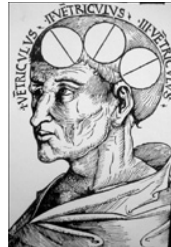
Figura 4. Los 3 ventriculos. (1506) Albertus Magnus.