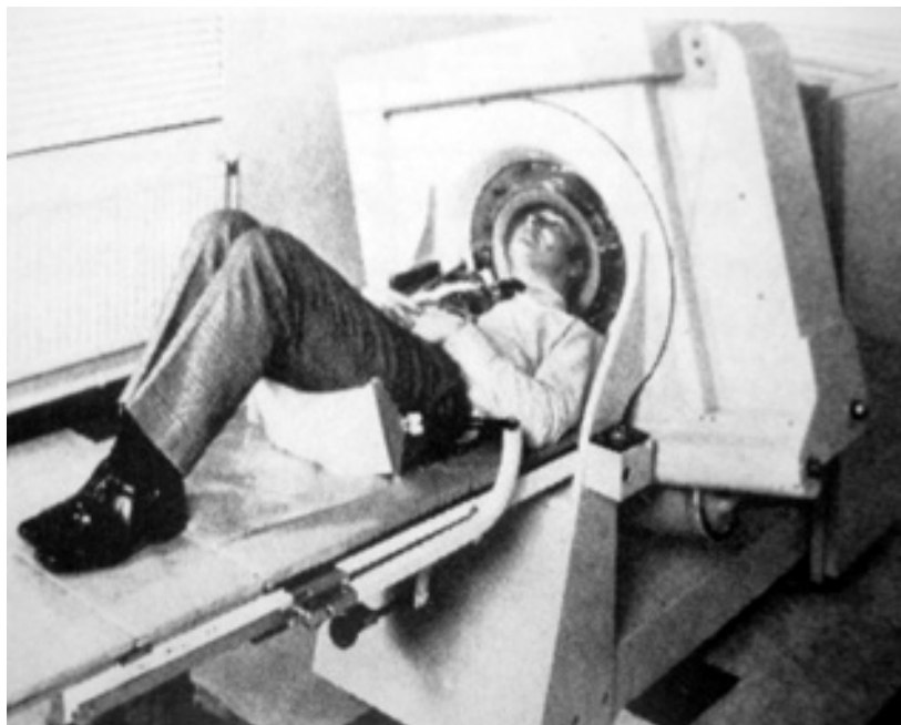
Figura 9. Primer prototipo de TAC (EMI) instalado en el Hospital Atkinson Morley's en Londres Ing. Hounsfield.