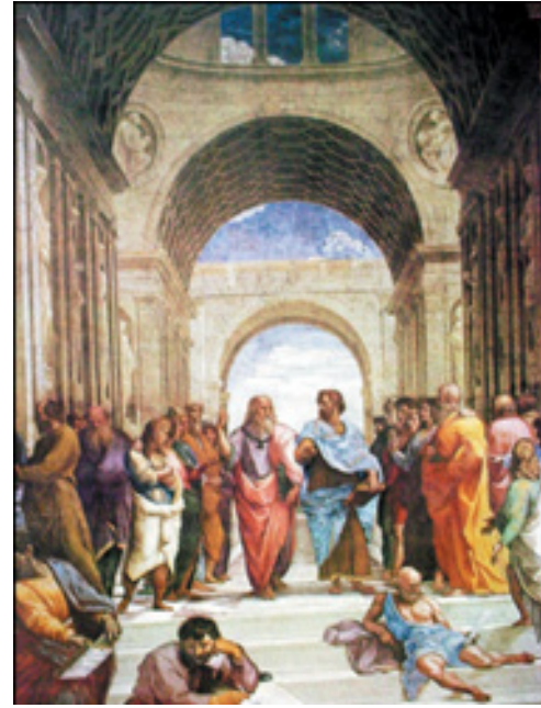
Figura 2. Escuela de Atenas. Teoría de los 4 Humores (agua, tierra, fuego y aire)