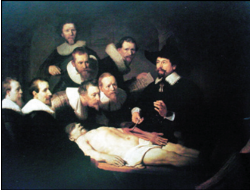
Figura 1. La lección de anatomía del Dr. Tulip. Rembrandt 1632.