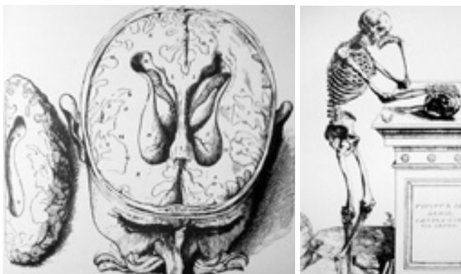
Figura 5. Andres Vesalio.