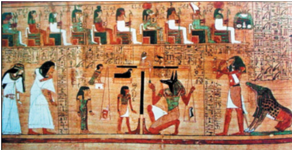
Figura 3. Escena del libro de los muertos. De Hunefer XIX Dinastia Tebas.