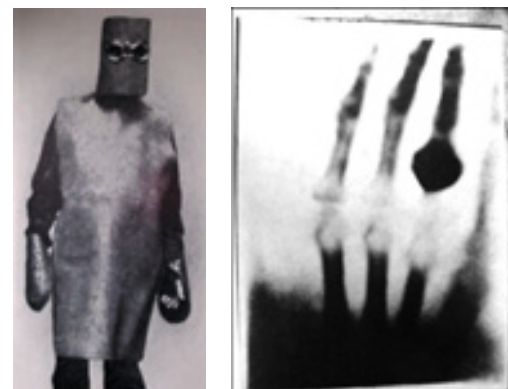
Figura 6. Primera imagen de rayos X obtenida en 1895.