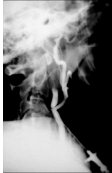
Figura 8. Angiografía percutánea directa.